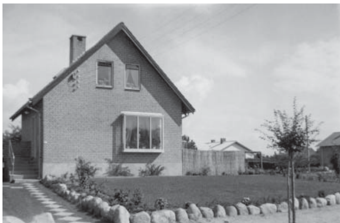
Figur 17. H. C. Ørstedsvvej 11 - set fra vejen.