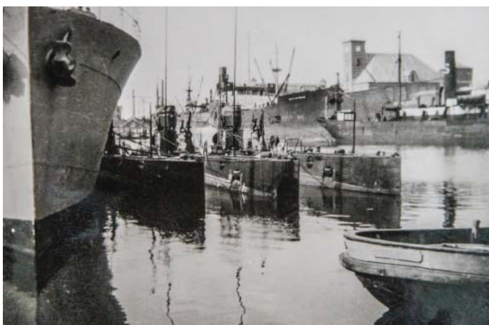
Figur 13. I Williams fotoalbum sad dette billede fra Svendborg havn med tyske u-både

Den borgerlige myndighed, der har udstedt attest om, at Bevisligheden er i orden: Odense Borgmesterkontor 6. April 1937 No. 179.