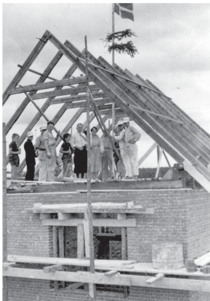
Figur 15. Rejsegildet 3. september 1955 på H. C. Ørstedesvej 11, Svendborg.

I forbindelse med lysthuset blev der bygget et lille drivhus på sydsiden, det blev bygget op af lysthuset. Der blev ganske langsomt ændret fra et drivhus til et fuglehus, der blev bygget en voliére ved siden af drivhuset, der blev fjernet en rude i drivhuset, så fuglene havde fri adgang mellem varmen inde og den friske luft ude.